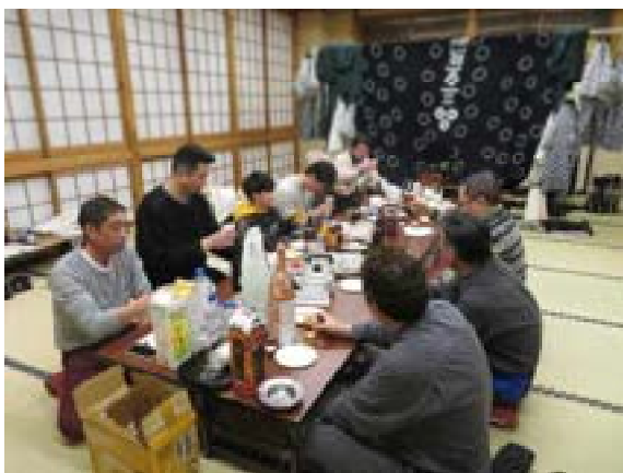
[写真28] 巡行後の直会 (R2. 1. 14)