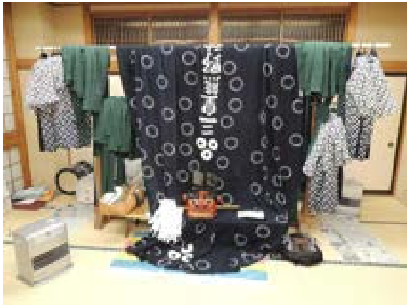
[写真26] 巡行期間中の獅子頭 (R3. 1. 8)