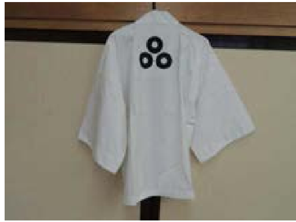
[写真42] 装束（背面） 上がり獅子で着用する白衣