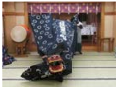
⑤頭を上げ前方に出てから 後ずさる