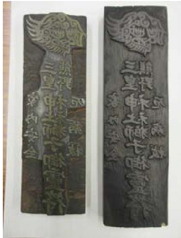
[写真44] 版木（左が棚谷・竹谷の版木）