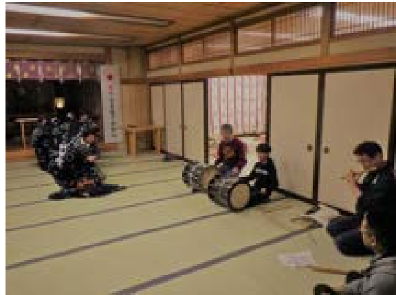
[写真46] 里宮で舞いに合わせた囃子の伝習 (R元. 10. 26)