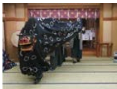
⑧前に出て、家人の頭を噛 む