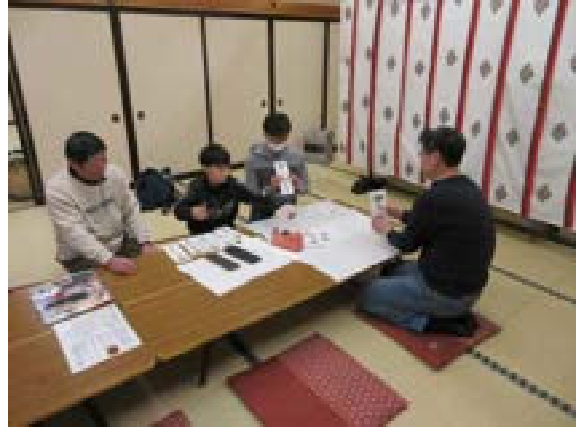
[写真13] 神札の準備 (R元. 12. 21)