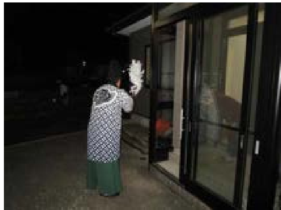
[写真21] 獅子を招き入れる家の玄関先で祓い (R2. 1. 14)