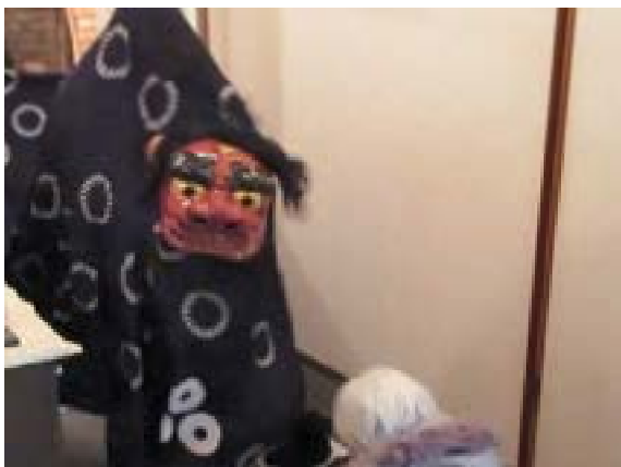
⑤頭を左右に小刻みに震わせる 「カ」→左右に震わせる