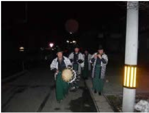
[写真18] 囃子方による先触れ(R2. 1. 14)