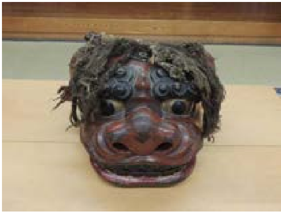
[写真5] 獅子頭（伝来）正面