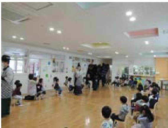
[写真53] 牛島ルンビニ園 (R3. 1. 13)