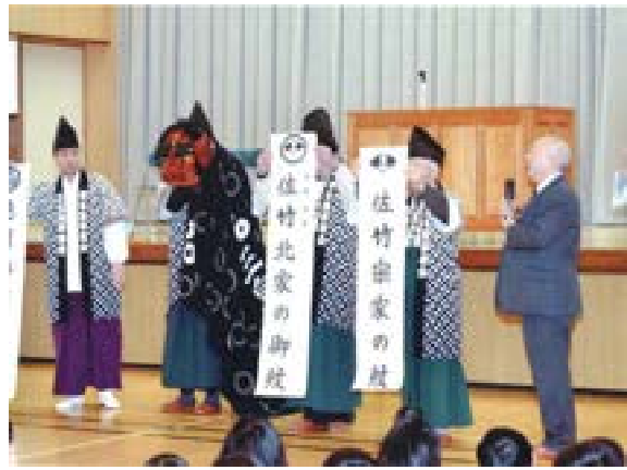
[写真52] 秋田市立牛島小学校 (R2. 1. 14) ふるさと教育