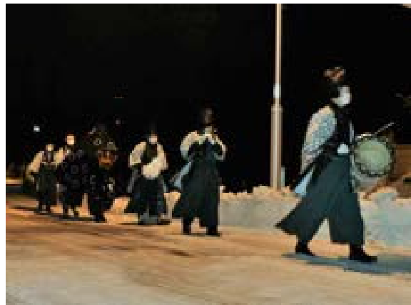
[写真17] 移動中の一行 (R3. 1. 14)