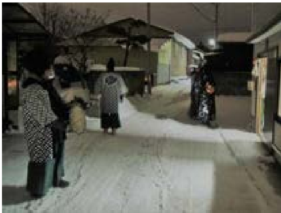
[写真20] 先祓いが各家の反応を確認中(R3. 1. 5)