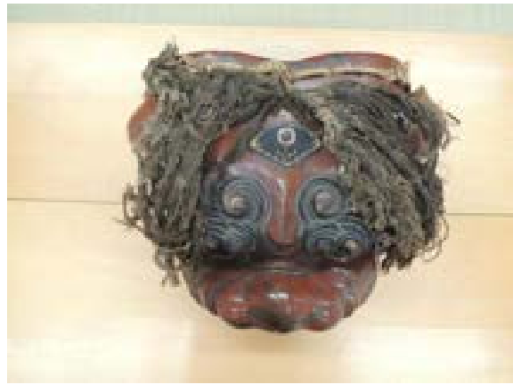
[写真6] 獅子頭（伝来）額