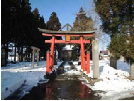
[写真57] 日吉神社（大仙市内小友）