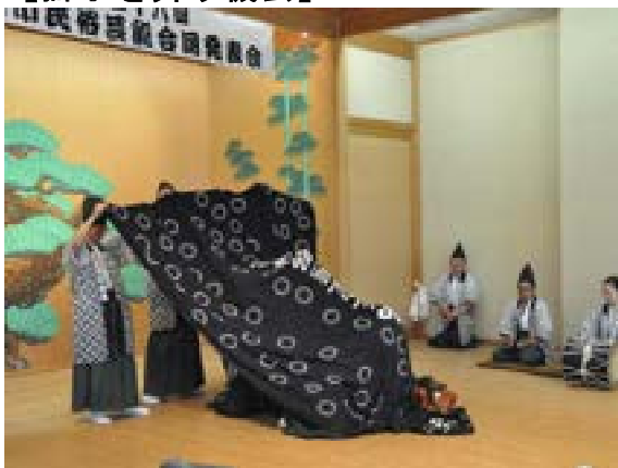
[写真49] 民俗芸能合同発表会 (R元. 7. 28)