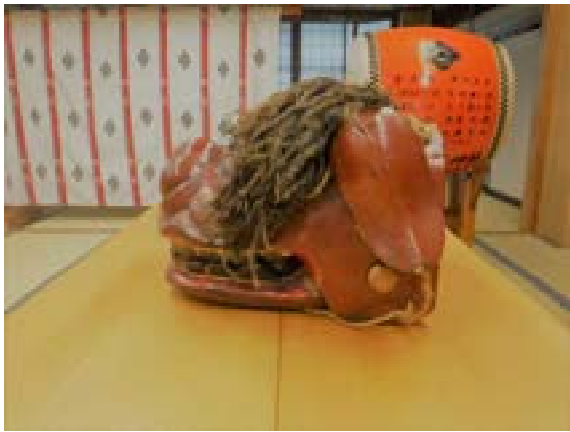
[写真7] 獅子頭（伝来）側面