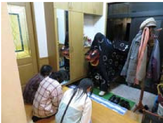
[写真22] 家々獅子(R2. 1. 6)