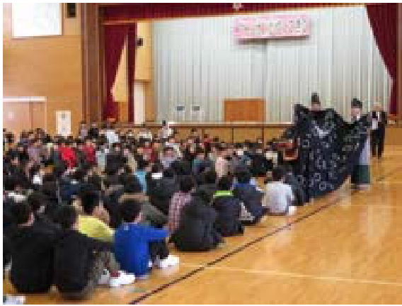
[写真51] 秋田市立牛島小学校 (R2. 1. 14) ふるさと教育