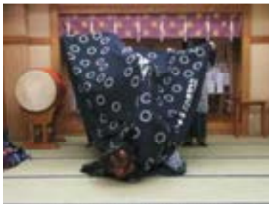
④頭を小刻みに震わせながら 輪を描く(反時計回りに 2回、時計回りに2回) ※反時計回りの場合は、 左上→正面下→右上 →ハッカミながら正面下 を1回とする。