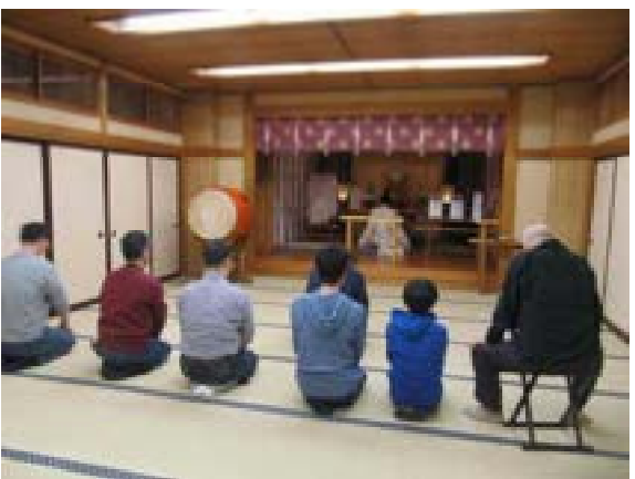
[写真29] 巡行の実施報告 (R2. 1. 24)