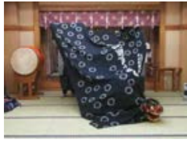
②頭を左右に動かす 正面→右→左→右→正面 →左→正面→右→正面