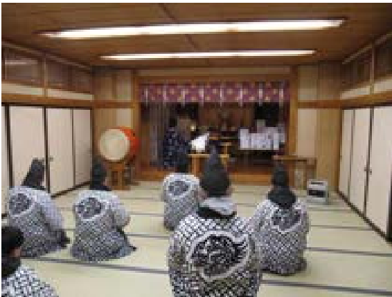
[写真14] 巡行前のお祓い (R2. 1. 6)