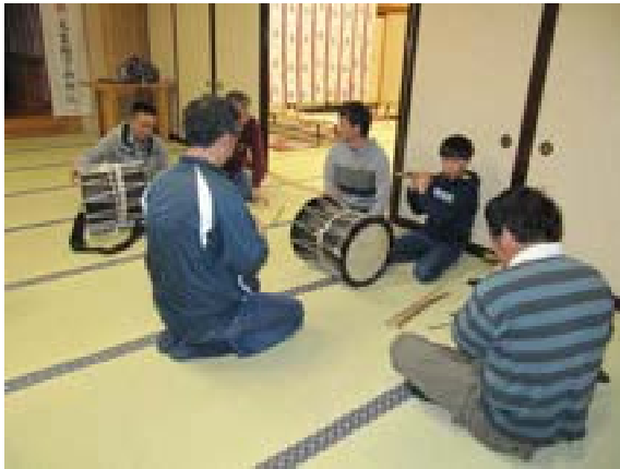
[写真45] 里宮で囃子の伝習 (R元. 10. 26)