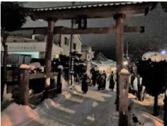
[写真16] 里宮を出発 (R3. 1. 5)