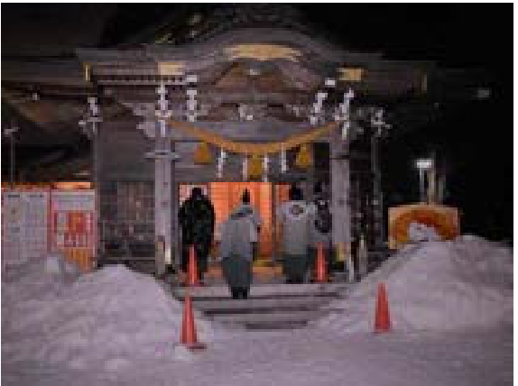
[写真27] 本宮で巡行終了 (R3. 1. 14)