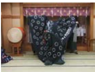
⑦中央で頭をねじる ※⑦の後、⑤→⑥→③→④ を繰り返す、⑧に続く。