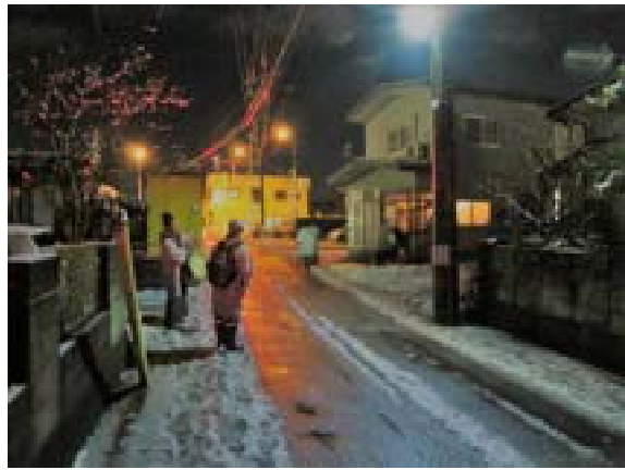
[写真25] 獅子を待つ囃子方とカゴ持ち (R2. 1. 11)