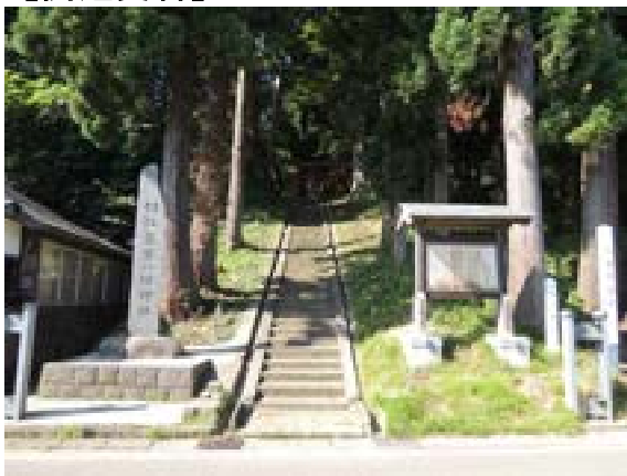
[写真55] 若宮八幡神社 (秋田市太平中関)