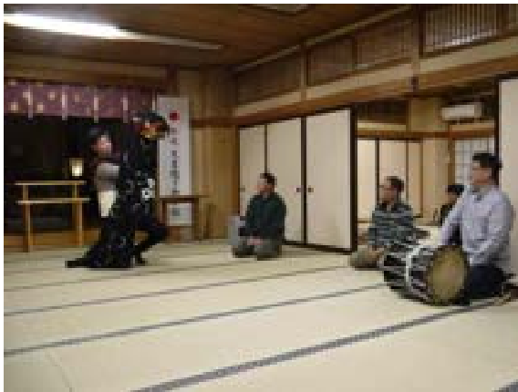
[写真47] 里宮で獅子の所作の伝習 (R元. 11. 30)