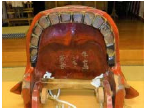
[写真8] 獅子頭（伝来）口中