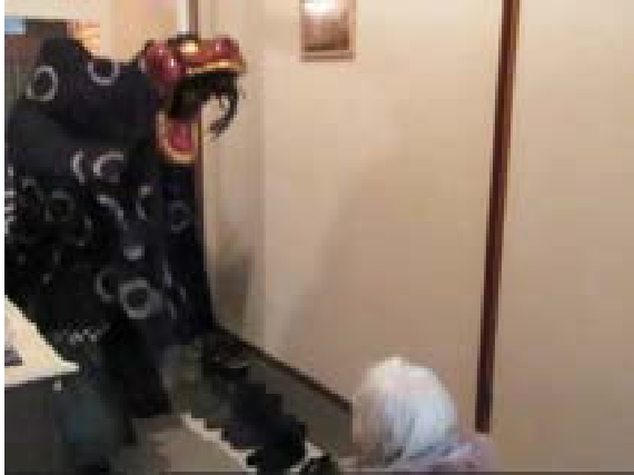
①獅子が玄関に入る 家人の正面で「カ・カ」