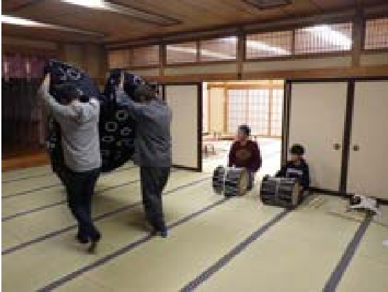
[写真12] 舞いと囃子の練習 (R元. 10. 26)