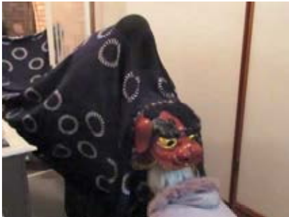
③家人の頭を噛む (鳴き声を発しながら噛む)