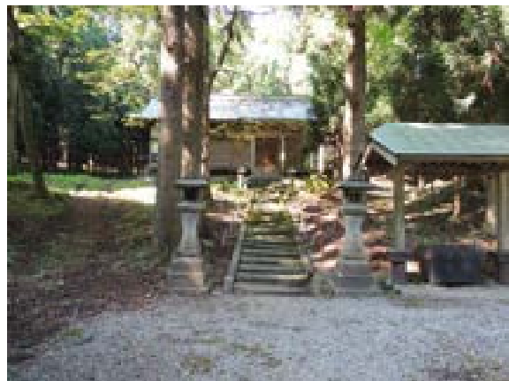
[写真56] 若宮八幡神社 (秋田市太平中関)