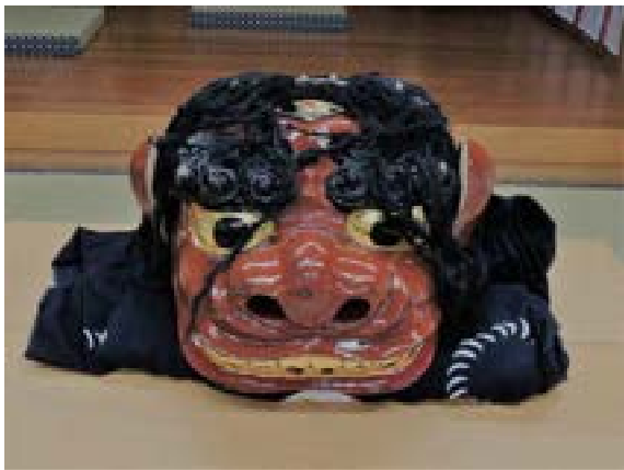
[写真9] 獅子頭（新）正面