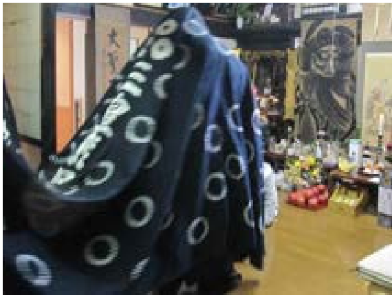
[写真24] 家々獅子 (R2. 1. 6)