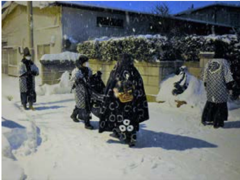
[写真3] 獅子舞の巡行 (R3. 1. 8)