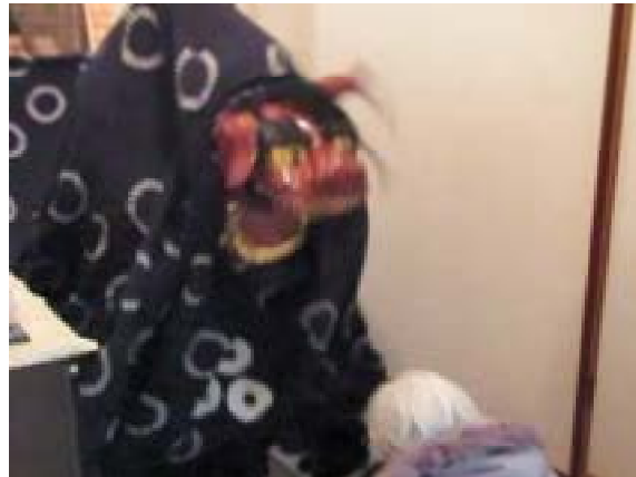
④家人から離れる 「カ・カ」