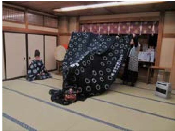
[写真15] 巡行前の奉納 (R2. 1. 6)