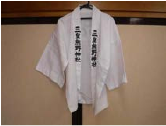
[写真41] 装束（正面） 上がり獅子で着用する白衣