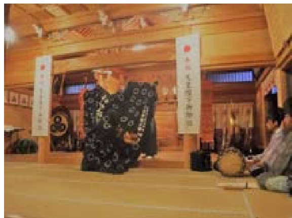
[写真50] 観月祭 (R元. 9. 14)