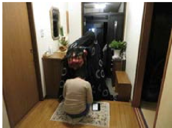
[写真23] 家々獅子(R2. 1. 14)