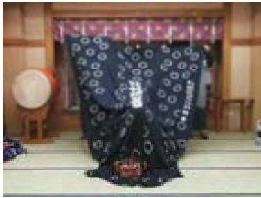
①伏せた状態で開始