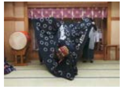
⑥歯ぎしりをする ※頭は中央で右上を向く ※歯ぎしりは、「カカ・カカ・ カ、カカカカカ・カ、カカ ・カカ・カ」で、ハッカミよ りも弱く歯を噛む ※この時お囃子は止む