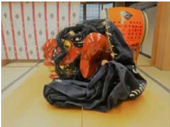
[写真11] 獅子頭（新）側面