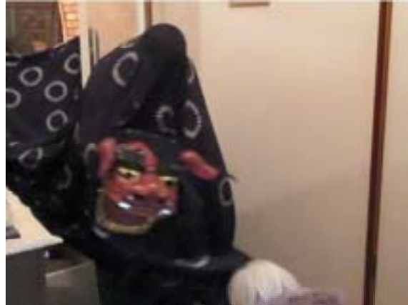
②家人の前で頭を左右に振る 向かって左で「カ」、右で「カ」、左で「カ・カ」