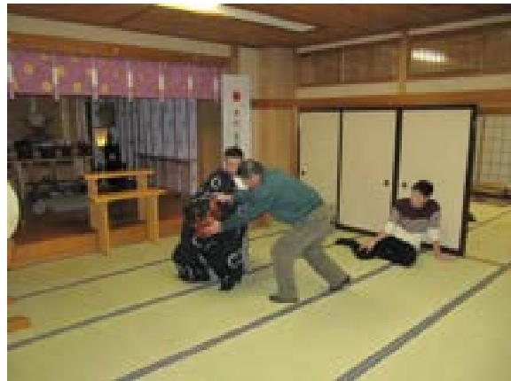
[写真48] 里宮で獅子の所作の伝習 (R元. 11. 30)