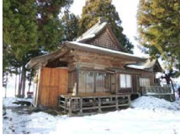
[写真58] 日吉神社（大仙市内小友）