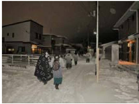
[写真19] 移動中の一行(R3. 1. 8)