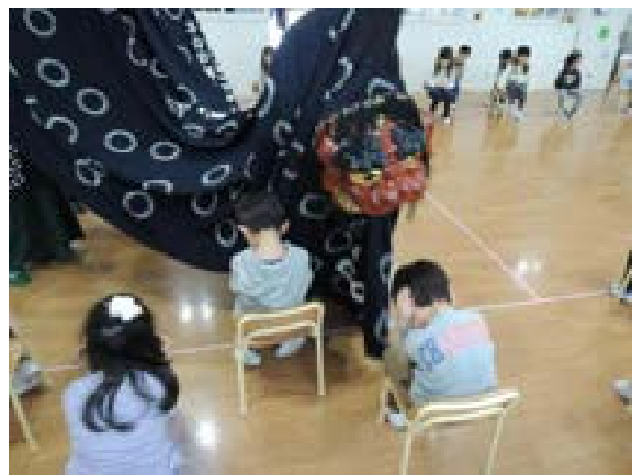
[写真54] 牛島ルンビニ園 (R3. 1. 13)