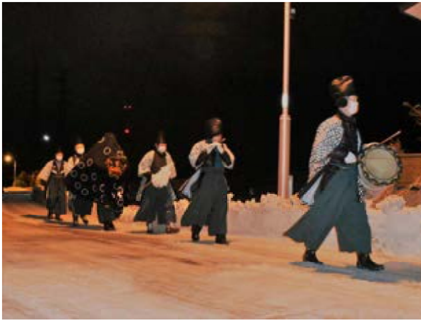
獅子舞の巡行 (R3. 1. 14)