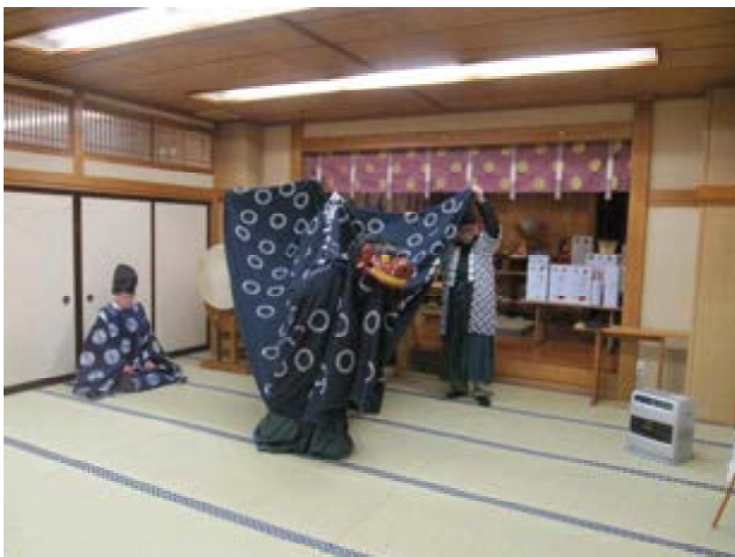
上がり獅子 (R2. 1. 6)