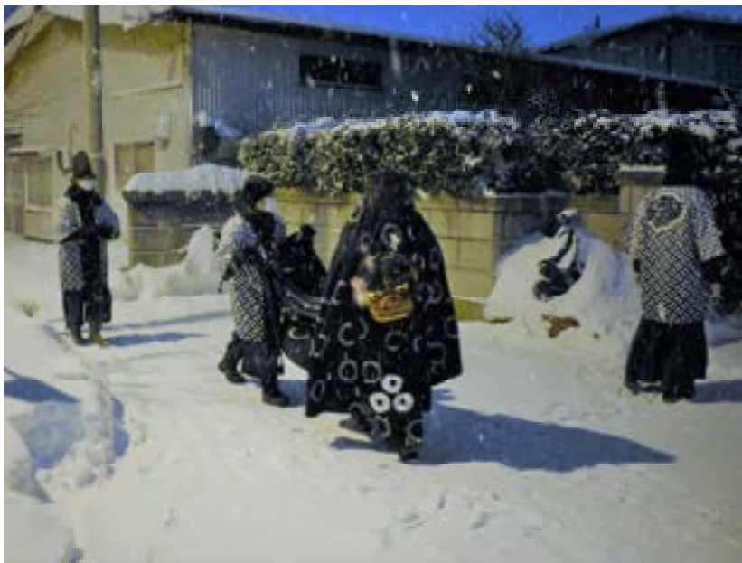
獅子舞の巡行 (R3. 1. 8)